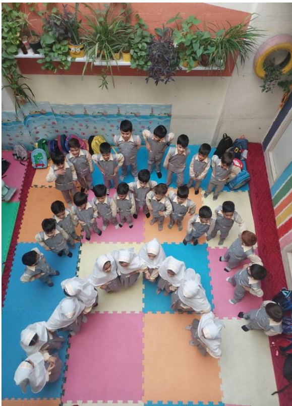
روز تربیت بدنی