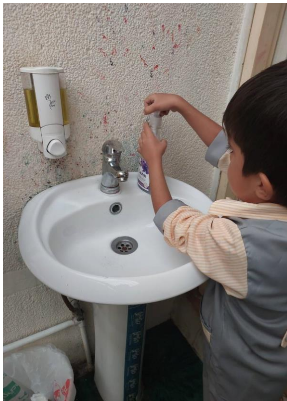
آموزش بهداشت فردی