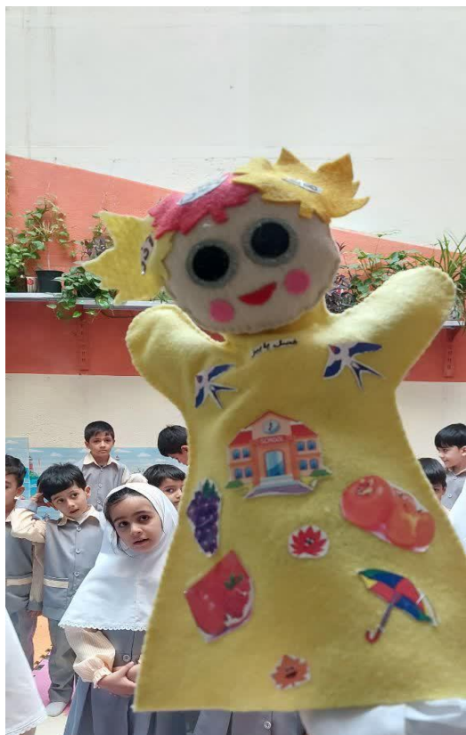
آشنایی با فصل پاییز