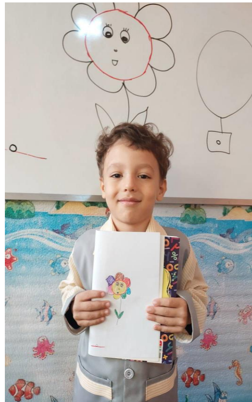
آشنایی با عدد صفر